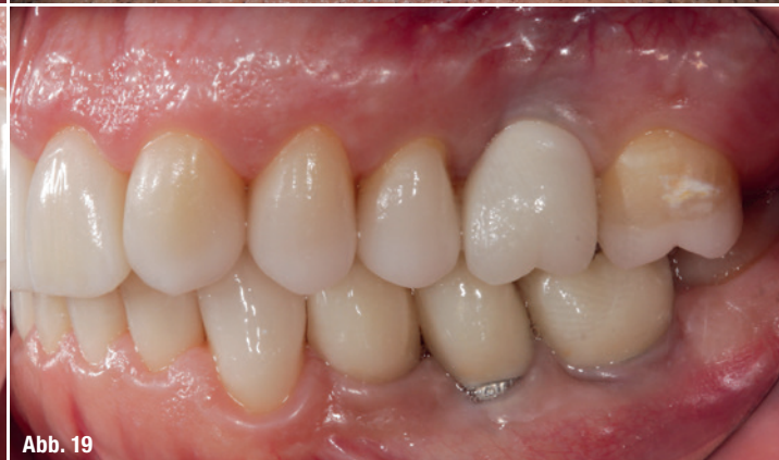
Abb. 16–19: Frontale Ansicht 24 Monate nach der Sanierung.

– provisorisches Zementieren der Implantatkronen auf Zirkonabutment (Temp-Bond™, Kerr)