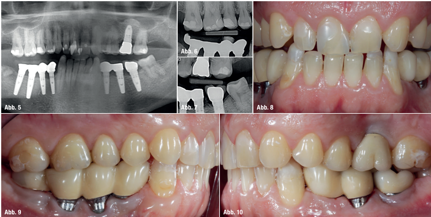
Abb. 5: OPT: Kein Anhalt auf nicht zahnverursachte Prozesse. Es zeigen sich insuffiziente Kompositfüllungen vor allem im Oberkiefer. Die langzeitprovisorische Versorgung der Implantate im UK-SZB genügt den parodontalen (Verblockung), funktionellen und ästhetischen Ansprüchen nicht mehr. Abb. 6: Randspalt an Kompositfüllung 16 mesial und distal. Abb. 7: Bissflügel links, CI Karies distal 24, CIII Karies distal 25 und CII mesial. Abb. 8: Die Front in Protrusion. Abb. 9 und 10: Die Links-/Rechts-Okklusion.