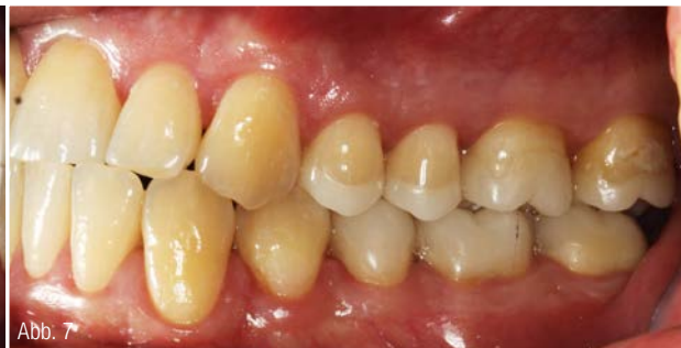
Abb. 6 und 7: Lateralansicht. Abb. 8 bis 10: Mock-up OK-Front.

lenke, unauffällige Öffnungs- und Schließbewegung, keine Druckdolenzen der Muskulatur bei Palpation. Gelegentliche leichte Kopfschmerzen.