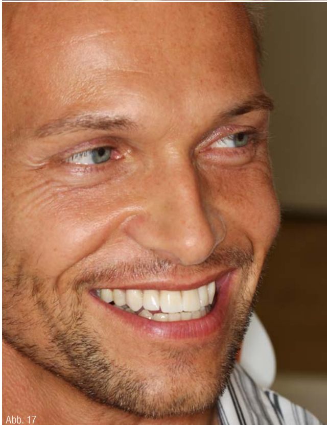
Abb. 11 bis 13: Überprüfung der Platzverhältnisse anhand des Wax-up gefertigten Silikonschlüssels vor der Präparation. Abb. 14: Fertiggestellte Veneerpräparation 13-23. Abb. 15: Bissnahme mit Wachsbissregistrator. Abb. 16: Provisorische Versorgung der präparierten Zähne. Abb. 17: Anprobe der vom Labor angelieferten Presskeramikveneers.